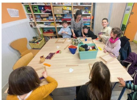
Les enfants sont entrain de tisser.