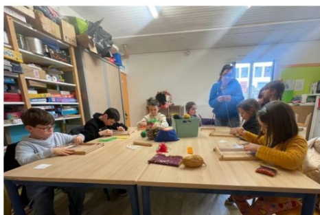
Le club des reporters qui interviewent les participants de l'atelier couture.